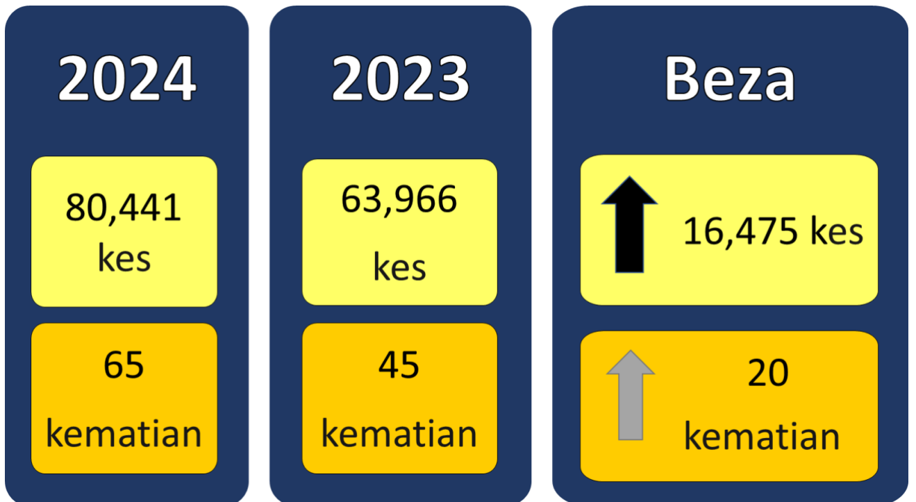
Gambarajah 2: Perbandingan kes dan kematian demam denggi sehingga Minggu Epidemiologi ke-28 tahun 2024 dan tempoh sama tahun 2023